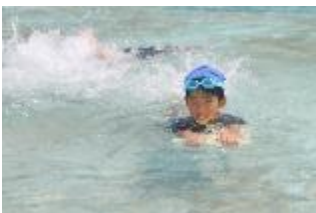
夏休みプール開放