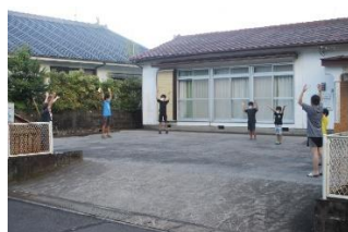
池崎地区ラジオ体操

7月25日(月)から5日間、保護者の皆様の御協力により、プール開放を行うことができました。毎日、10名以上の参加がありました。